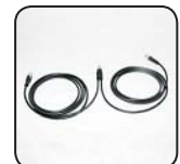
SMA Power Balancer Y Kabel PBL-YCABLE-10