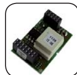
RS485 Schnittstelle 485PB-NR